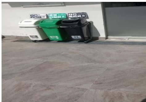
Almacenamiento de Residuos Ordinarios y Peligrosos y canecas con nuevo código de colores