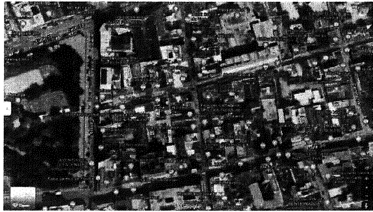
Mapa uso del suelo