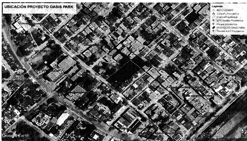
Figura 1. Ubicación construcción Box Culvert, proyecto Oasis Park.

El canal pluvial para intervenir se encuentra ubicado en el barrio Providencia de la ciudad de Cartagena, atravesando de manera transversal el predio, donde realizaran la construcción del proyecto OASIS PARK, con coordenadas 10°23'34.43"N - 75°28'25.03"W como se puede identificar en la Figura 1.