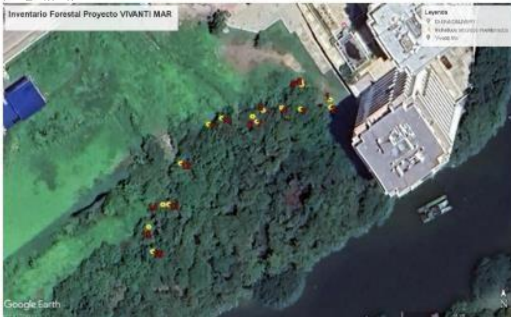
Tabla 2. IMAGEN DE GOOGLE EARTH, 16 ÁRBOLES A INTERVENIR