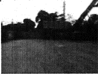
Figura 5. Interior del peto donde se realizará el acopio, descargue y llenado de madera con objeto a exportación.