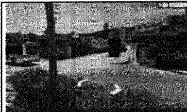
Figura 1. Fachada del Peto de destino de la empresa MAGNUM INTERNATIONAL SAS, en el Km 3 de la Vía a Manantial, fuente de foto: Modificado de Google Earth.

6. Es obligación de la empresa en el momento en que decida desistir voluntariamente del registro de libro de operaciones ante EPA Cartagena, presentar solicitud escrita con firma del representante legal de la sociedad radicando en la oficina de atención al ciudadano de forma física o virtual su petición. Deberá especificar el motivo por el cual presentó la solicitud para efectos de una visita técnica y será únicamente viable, mediante informe y/o concepto técnico realizado por un funcionario competente, donde se corrobore el cumplimiento total de las obligaciones consagradas en el acto administrativo que dio lugar al registro del libro de operaciones. Su obligación cesará jurídicamente cuando la Oficina Asesora Jurídica del Establecimiento Público Ambiental notifique la cancelación de dicho registro. Es de aclarar que el funcionario podrá solicitar la información que considere pertinente respecto a la visita técnica