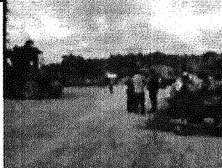
Figura 6. Interior del peto donde se realizará el acopio, descargue y llenado de madera con objeto a exportación.