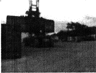
Figura 3. Interior del peto donde se realizará el acopio, descargue y llenado de madera con objeto a exportación.