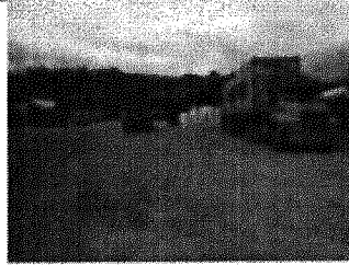
Figura 4. Interior del peto donde se realizará el acopio, descargue y llenado de madera con objeto a exportación.