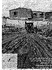
Figura 3. Evidencia de construcción demolición y adecuación de terreno. Fuente: Albores, 2024.

https://epacartagena.gov.co/registroconstrucciondemolicion/1649040416132.jpg