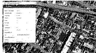
Figura 2. Ubicación geográfica predio con Matricula Inmobiliaria No. 060-23246, en las coordenadas geográficas 10°24'26" N - 75°30'44" W. Fuente: AEDAS, 2024.

demolición y adecuación de terreno generadoras de Residuos de Construcción y Demolición - RCD, en el barrio España Cra. 44C - 304 43., cuyo predio se identifica con la Matricula Inmobiliaria No. 060-23246 y Referencia Catastral N° 010901560013000. La ubicación georreferenciada aproximada corresponde a las coordenadas 10°24'26" N - 75°30'44" W, como se aprecia en la figura 2.