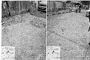
Figura 4. Derrame de RCD sobre la vía exterior de acceso de la obra.

https://epacartagena.gov.co/registroconstrucciondemolicion/1649040416132.jpg