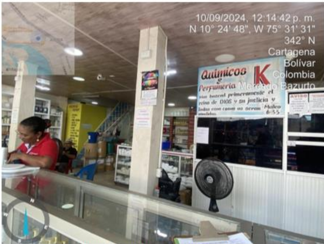
Figura 1. Fachada del establecimiento

QUIMICOS Y PERFUMERIA KAREN, se encuentra inscrito en la cámara de comercio como un establecimiento dedicado al comercio al por mayor de productos farmacéuticos y medicinales, cosméticos y artículos de tocador en establecimiento especializados. Fabricación de jabones y detergentes preparados para limpiar y pulir, perfumes y preparados de tocar. CIU 4773, 4774.