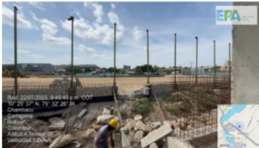
Figura 2. Conformación de gradería

Adicionalmente en la visita se presentaron los PINES TRANSPORTADORES de las volquetas empleadas para el manejo de los residuos generados en el proyecto y certificados de mantenimientos realizados a las unidades sanitarias portátiles. Sin embargo, no se presentaron certificados de disposición de residuos sólidos, y no se evidenciaron puntos de acopio de residuos conformados, por el contrario, los residuos estaban apilados en diferentes puntos del proyecto indistintamente de su tipo.