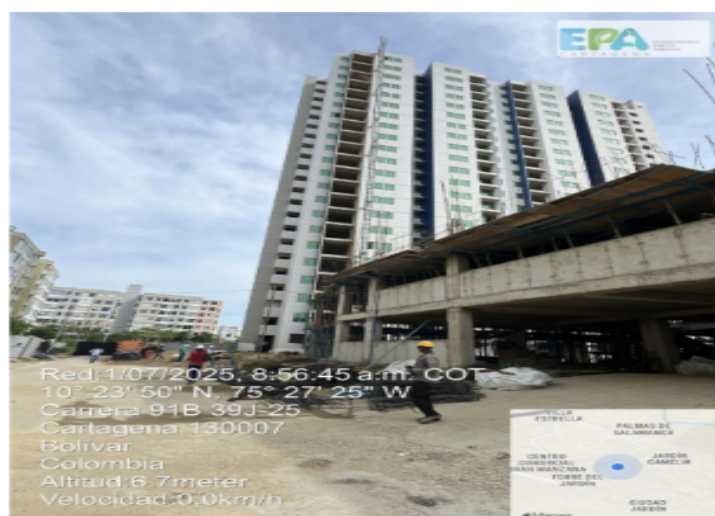
Figura 2. Actividades de fundida y conformación del parqueadero.

El proyecto no cuenta con puntos de acopio establecidos para los RCD, ni realiza separación en la fuente para los diferentes tipos de residuos.