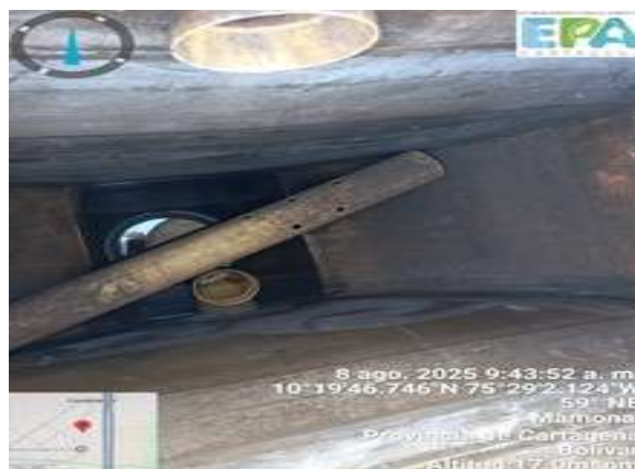
Durante el mes de enero del presente año 2025, se hicieron varias recolecciones de ARD, por lo que se anexará el certificado con la cantidad total gestionada del mes. (Ver figura 8)

8 ago. 2025 9:41:53 a. m. 10°19'46.698"N 75°29'2.19"W 240° SW Mamona Provincia de Cartagen Bolívar Altitud: 20.1msnm 8 ago. 2025 11:05:04 a. m. 10°19'49.65"N 75°29'3.702"W 103° Via a Gambot Mamona Provincia de Cartagen Bolívar Altitud: 20.1msnm