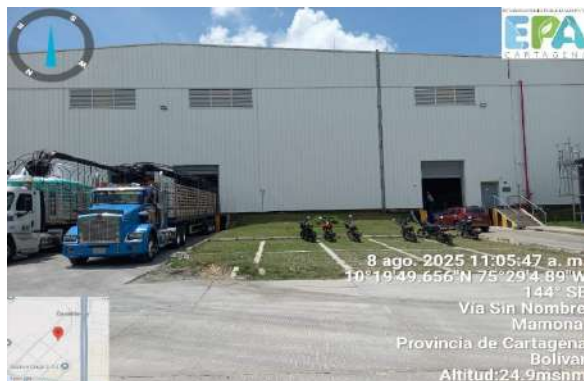
Figura 2. Fachada principal de APPLIK LOGISTICA ZONA FRANCA S.A.S.

APPLIK LOGISTICA ZONA FRANCA S.A.S., presta servicios logísticos y es especialista en el almacenamiento, etiquetado y distribución de mercancías importadas; durante el