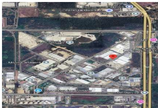
Figura 1. Ubicación geográfica de APPLIK LOGISTICA ZONA FRANCA S.A.S.