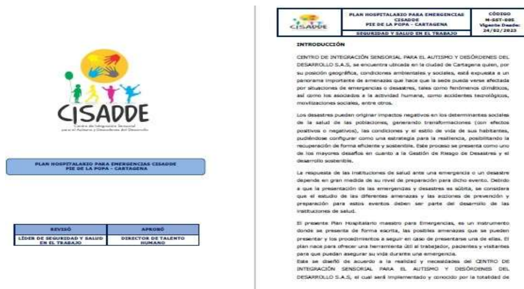
Imagen 6. Plan de Continencia

Cuenta con el Plan de contingencia de acuerdo con lo establecido en el artículo 2.2.6.1.3.1. literal h del decreto 1076 de 2015. Tienen conformada una brigada, cuenta con herramientas y directrices en cada caso para derrames, ruptura de bolsas o cualquier accidente que se presente en el movimiento interno de los residuos.