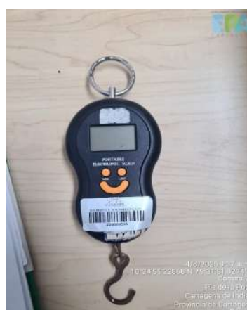
Foto 4. Bascula residuos RESPEL