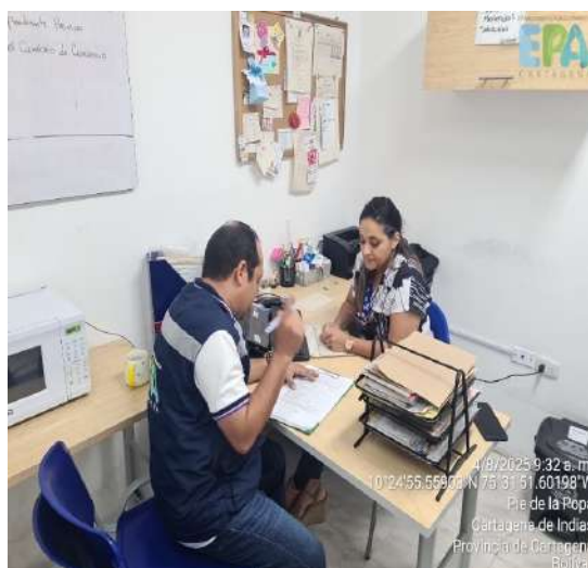
Foto 2. Desarrollo de la Visita