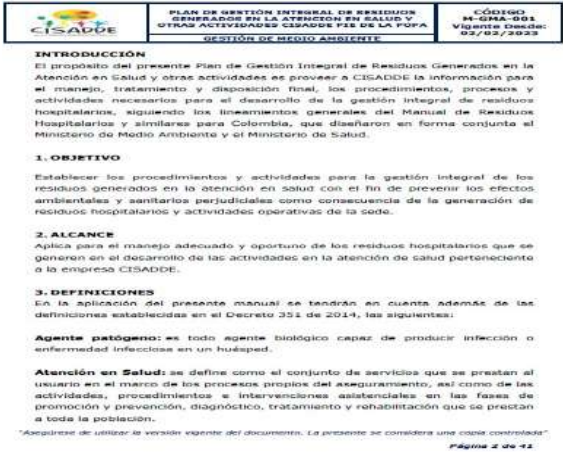
Imagen 2. PGIRASA

4.8. Capacitaciones CISADDE CARTAGENA - SEDE PIE DE LA POPA presentó evidencia de las capacitaciones al personal, en temas como: residuos Sólidos, reducir, reutilizar y reciclar.