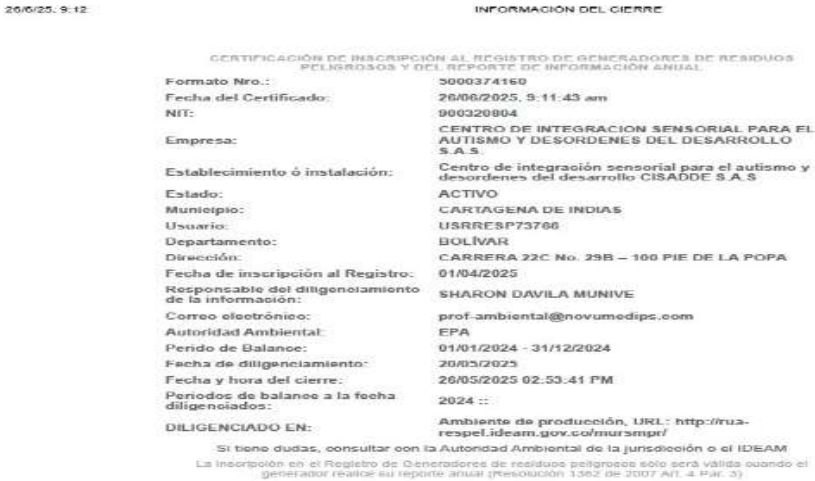
Imagen 4. Cierre RESPEL

4.9. Información SIAC Subsistema RESPEL CISADDE CARTAGENA - SEDE PIE DE LA POPA se encuentra inscrito en el registro de generadores de residuos peligrosos desde el 1 de abril de 2025. Ha dado cierre al período de balance correspondiente al año 2024, con fecha 26/05/2025, incumpliendo con lo establecido en el artículo 5 de la resolución 1362 de 2007.