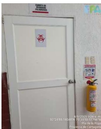
Foto 3. Puerta de almacenamiento residuos RESPEL