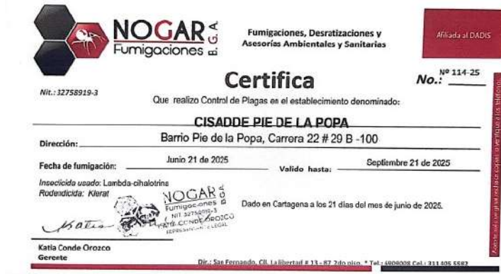
Imagen 7. Certificado Fumigación.

De acuerdo a lo anterior, se emite el siguiente: