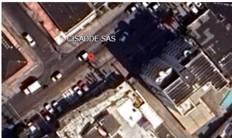
Figura 1. Localización 10°24'55"N 75°31'51"W