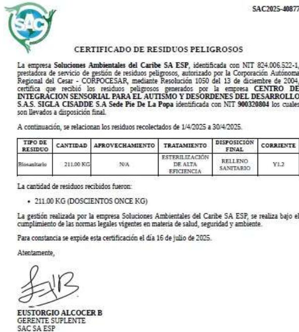
Imagen 5. Certificado recolección RESPEL

Durante la visita presentó certificado de residuos peligrosos correspondiente al mes de abril del año 2025.