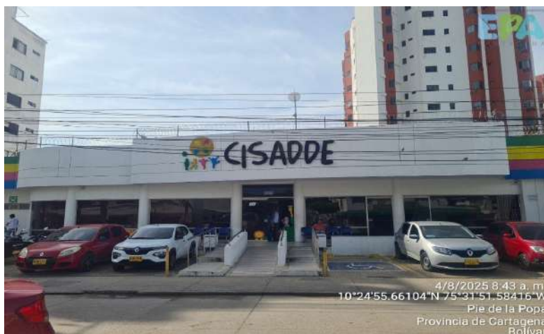
Foto 1. Vista Externa