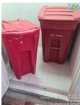
Foto 5. Dique Residuos RESPEL