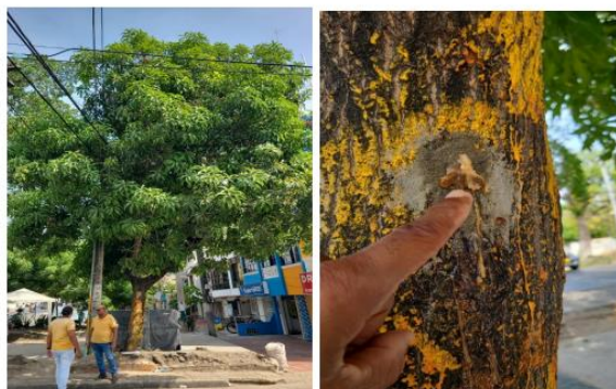
Árbol de Mango presuntamente envenenado