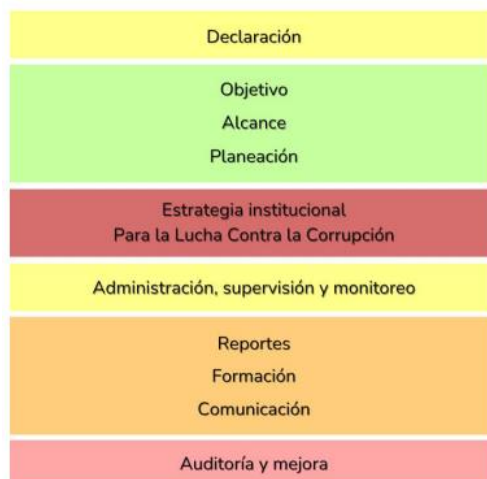
Estructura del programa de Transparencia y Ética Pública

La Oficina Asesora de Control Interno, con base en lo señalado en el anexo técnico del Decreto 1122 de 2024, relacionado con el programa de transparencia y ética pública, reviso y analizó la información publicada por el EPA Cartagena y la suministrada por la Oficina Asesora de planeación, respecto a la estructura del programa y sus dos componentes obligatorios: transversal y programático