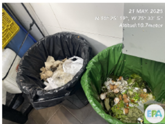
Figura 5: Almacenamiento de Residuos sólidos

Durante la inspección se evidencio que el restaurante realiza la debida separación en la fuente de los residuos orgánicos y no aprovechables generados en el desarrollo normal de sus actividades, cuenta con el código de colores, los residuos aprovechables como cartón, vidrio, plásticos son separados adecuadamente como lo establece la resolución 2184 art 4 de 2019. No realizan capacitaciones al personal en el manejo integral de residuos sólidos.