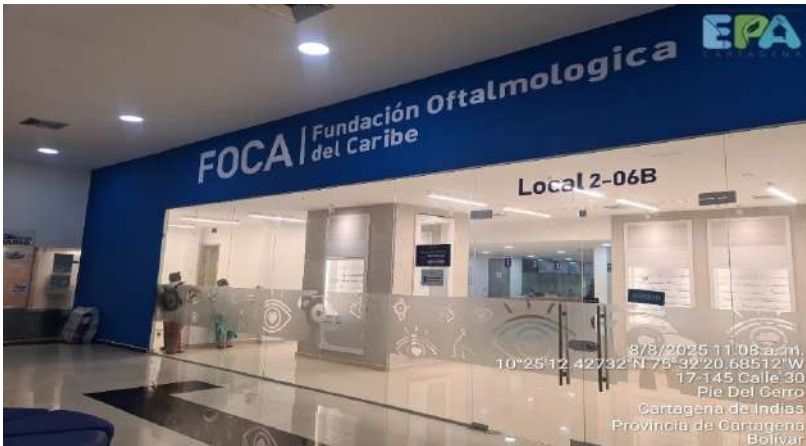
Foto 1. Vista Externa