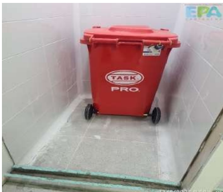
Foto 5. Dique Residuos RESPEL