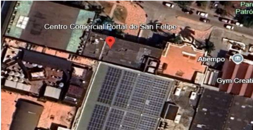
Figura 1. Localización 10°25'14"N 75°32'30"W