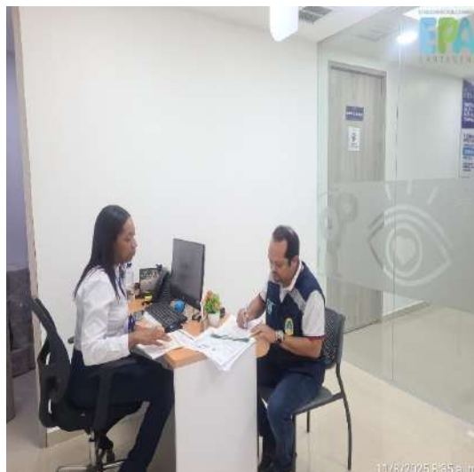
Foto 2. Desarrollo de la Visita