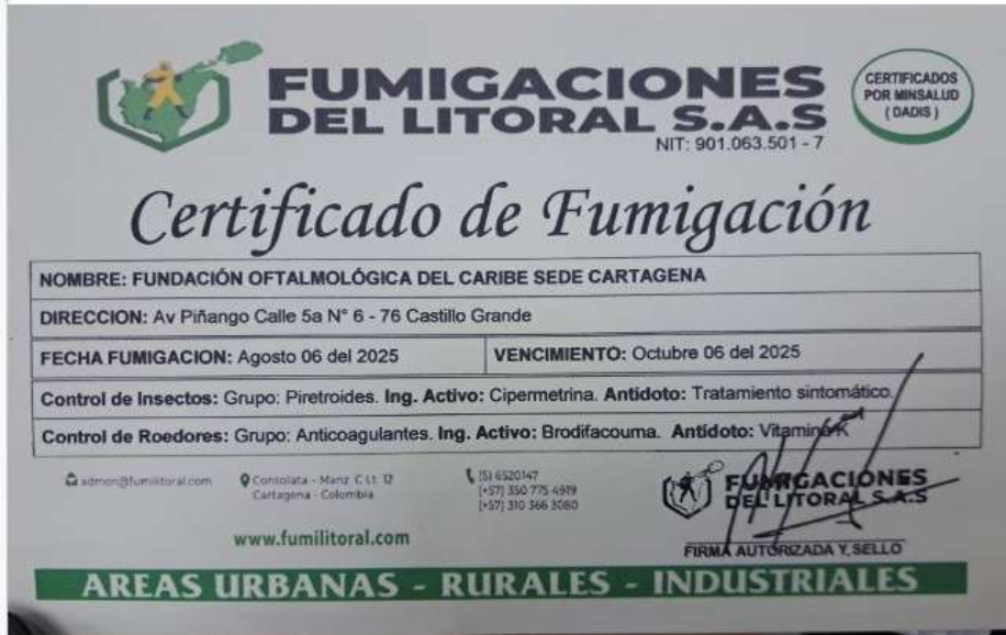
Imagen 7. Certificado Fumigación

Realiza fumigaciones con la empresa Fumigaciones del Litoral S.A.S. La última fumigación la realizaron el día 6 de agosto 2025, con periodicidad cada dos meses.