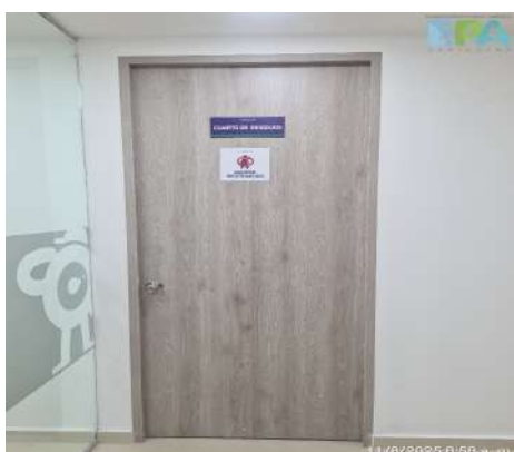
Foto 3. Puerta de almacenamiento residuos RESPEL