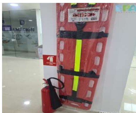
Foto 6. Extintor