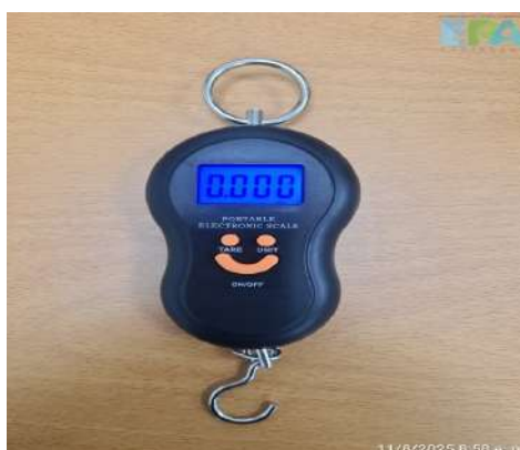
Foto 4. Báscula residuos RESPEL