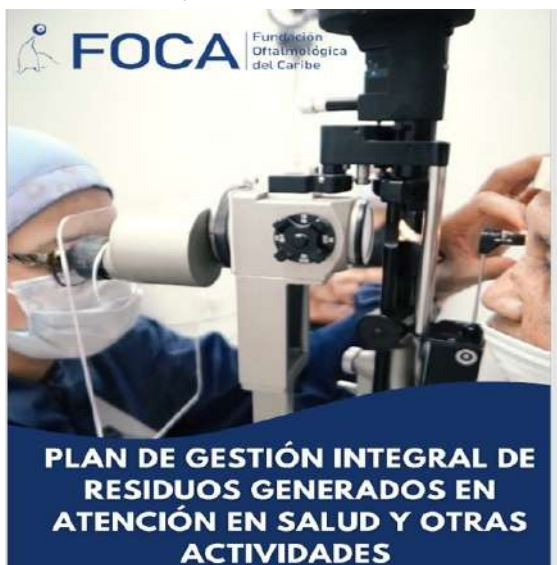
Imagen 1. PGIRASA

FUNDACION OFTALMOLOGICA DEL CARIBE presentó actas de las reuniones realizadas por el Grupo Administrativo de Gestión Ambiental (GAGA), evidenciando cumplimiento con lo establecido en el Manual de Procedimientos para la Gestión Integral de los Residuos Hospitalarios y similares.