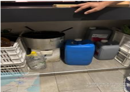
Figura 3: Almacenamiento temporal de ACU

Los aceites usados resultado de la operación de la cocina son almacenados en pimpinas plásticas ubicados cerca de la cocina los cuales no se encuentran debidamente sellados, señalizados, no cuentan con un kit antiderrames, estibas antiderrames, que permitan tomar acciones de contingencia en caso de derrames.