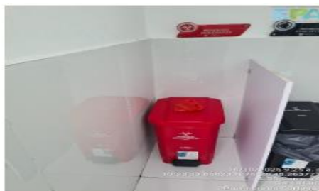
Foto 4. Residuos RESPEL