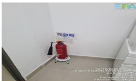
Foto 5. Extintor