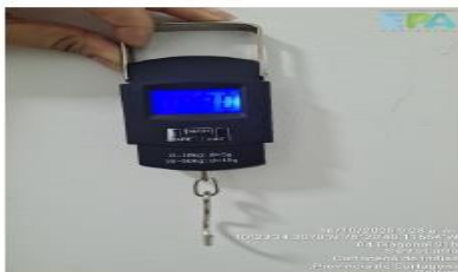
Foto 5. Bascula