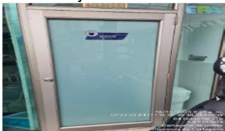
Foto 3. Puerta de almacenamiento residuos RESPEL