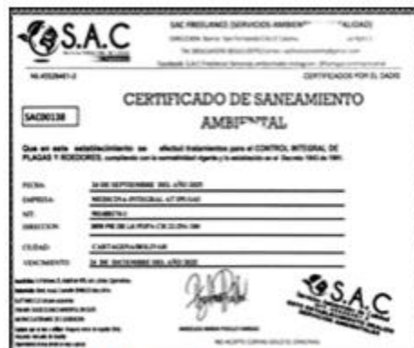
imagen 6. Certificado de fumigación

MEDICINA INTEGRAL AT IPS S.A.S realiza el control de plaga con la empresa Servicios Ambientales de Calidad – SAC Freelance trimestralmente. La última fumigación que se realizó fue el 24 de septiembre de 2025 como se evidencia en la imagen 6.