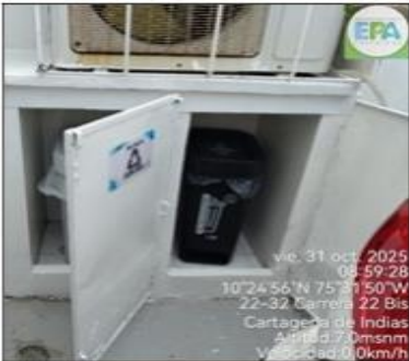
foto 4. Contenedor residuos ordinarios