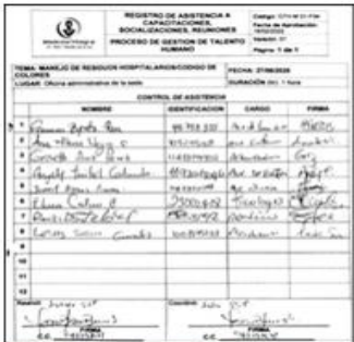
imagen 4. Asistencia Manejo de Residuos Hospitalarios

MEDICINA INTEGRAL AT IPS S.A.S realizó capacitaciones/socializaciones en temas ambientales como manejo de residuos hospitalarios cumpliendo con el literal g del artículo 2.2.6.1.3.1 del decreto 1076 de 2015 y numeral 4.1.1.3.2 de la resolución 591 de 2024. Conforman grupo administrativo de gestión ambiental y sanitaria – GAGAS.