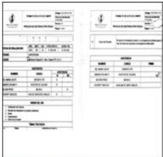
imagen 5. GAGAS

MEDICINA INTEGRAL AT IPS S.A.S no está inscrita en línea en el registro de Sistema de Información Ambiental Colombiano como generador de residuos o desechos peligrosos, por lo tanto, no ha reportado ningún periodo balance. Teniendo en cuenta que la entidad se clasifica como pequeño generador de acuerdo a las categorías establecidas en el artículo 2.2.6.1.6.2 del decreto único reglamentario del sector ambiente y desarrollo sostenible 1076 de 2015 y la tabla 2 del numeral 4.1.1.3.1.3 Identificación, clasificación y cuantificación de los residuos generados de la resolución promedio, y con base al cálculo del promedio móvil de tomando las cantidades generadas a partir del consolidado mensual formato RH1 de los últimos 6 meses de mayo a octubre (incluyendo el último mes como lo estipula la resolución 591 de 2024) se obtuvo un promedio móvil de 12,05kg. Esto, quiere decir que la MEDICINA INTEGRAL AT IPS S.A.S está obligado a registrarse en línea y reportar en la nueva plataforma de Registro Único Ambiental – RUA para el próximo año 2026.