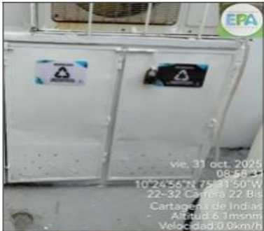
foto 3. Alm. residuos ordinarios

Durante la visita se evidenció que MEDICINA INTEGRAL AT IPS S.A.S genera residuos no peligrosos ordinarios como residuos de barrido, botellas plásticas, restos comestibles, papel y vasos desechables, los cuales son dispuestos en bolsas y canecas plásticas de acuerdo a su finalidad (blanco, negro o verde). Estos son recolectados por la persona asignada del aseo y llevados al lugar de almacenamiento temporal donde posteriormente son entregados a la empresa gestora Veolia S.A.S ESP 3 veces por semana.