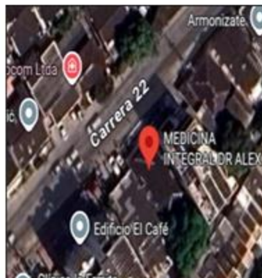
imagen 1. Vista satelital MEDICINA INTEGRAL AT IPS S.A.S

MEDICINA INTEGRAL AT IPS S.A.S está localizada el barrio Pie de la Popa carrera 22 #29ª – 184 en la ciudad de Cartagena de Indias D.T. y C. con coordenadas geográficas 10°24'56" N – 75°31'50" O.