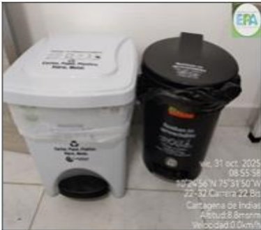
foto 5. Caneca blanca y negra.