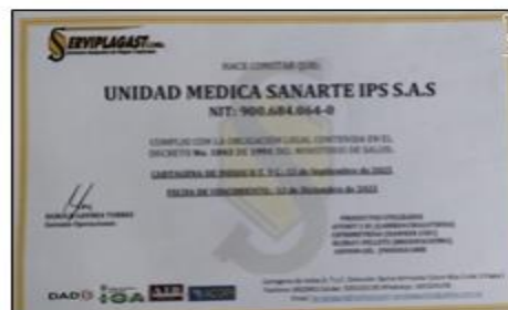
imagen 6. Certificado de fumigación

UNIDAD MÉDICA SANARTE IPS S.A.S realiza el control de plaga con la empresa SERVIPLAGAST Ltda. cada tres meses. La última fumigación que se realizó fue el 13 de septiembre de 2025 como se evidencia en la imagen 6.