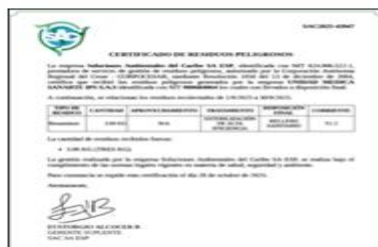
imagen 3. Certificado disposición final septiembre 2025