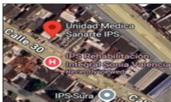
Imagen 1. Vista satelital UNIDAD MÉDICA SANARTE IPS S.A.S

UNIDAD MÉDICA SANARTE IPS S.A.S está localizada el barrio Pie de la Popa calle 30 #21 – 140 en la ciudad de Cartagena de Indias D.T. y C. con coordenadas geográficas 10°25'6" N – 75°31'49" O.