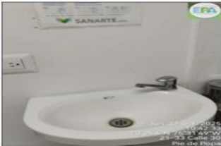
foto 4. Lavamanos en el sitio de toma de muestra de sangre.