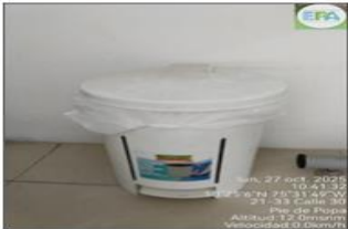
foto 5. Caneca residuos aprovechables

Con base a los servicios que presta la entidad y al consolidado mensual formato RH1 presentado en la visita los residuos peligrosos generados en UNIDAD MÉDICA SANARTE IPS S.A.S son de riesgo biológico como biosanitarios y cortopunzantes. Los residuos cortopunzantes son dispuestos en guardián de seguridad en consecuencia de toma de