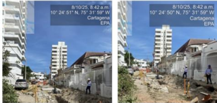
Ilustración 1. Estado actual de obra. Fuente: Autores.

de lezo y manga se encuentra un poco atrasado debido a emergencias presentadas por parte de la empresa Aguas de Cartagena, por ende, está en etapa de conformación de capa de pavimento y conformación de andenes está un poco atrasada.