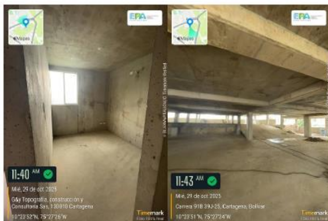
Figura 3. actividades de acabados de entrega.

De acuerdo con la información suministrada, actualmente se encuentran desarrollando actividades de acabados de entrega, con un avance de obra del 98% de acuerdo a su cronograma de actividades.