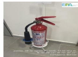
foto 6. Extintor