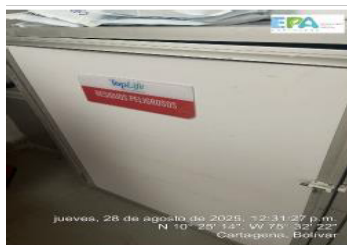
Foto 3. cuarto de almacenamiento