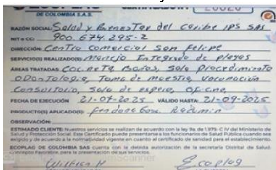
Figura 4. Certificado fumigación.

SALUD Y BIENESTAR IPS SEDE TOP LIFE realiza fumigaciones con la empresa ECOPLAG DE COLOMBIA S.A.S de manera trimestral. La última fumigación la realizaron el día 21 de julio del 2025. Se anexa foto de certificado