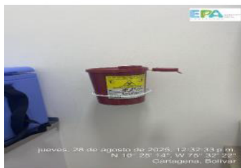
foto 5. Guardian de seguridad