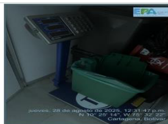
foto 4. Báscula