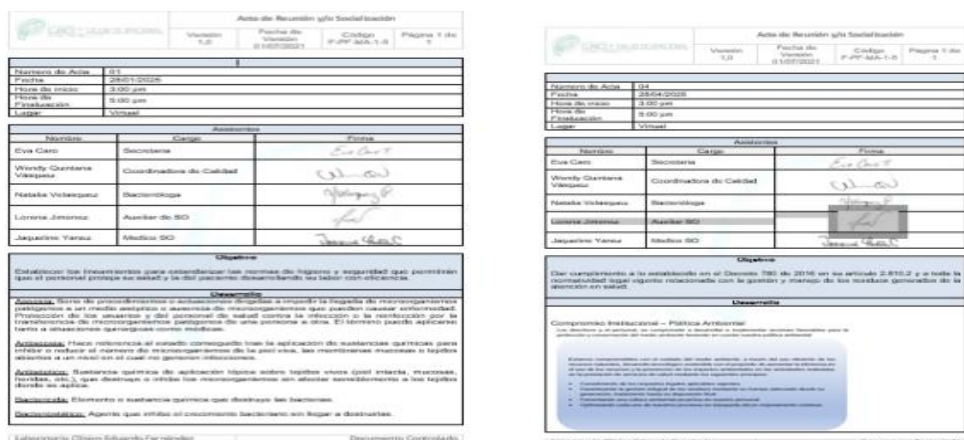
Imagen 3. Capacitaciones Imagen 4. Capacitaciones

LABORATORIO CLINICO Y SALUD OCUPACIONAL EDUARDO FERNANDEZ S.A.S, presentó evidencia de las capacitaciones al personal en temas de bioseguridad,