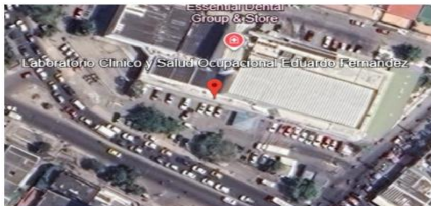
Figura 1. Localización 10°23'31"N 75°28'49"W

Calle 31 – 69 65 P 1 Local 14 Urbanización Santa Lucia