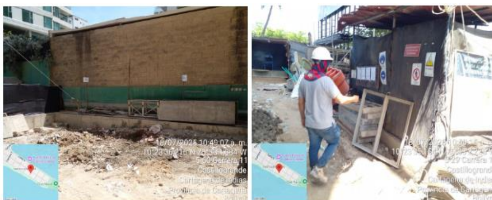
Figura 2. Puntos de acopio de residuos y materiales en obra. Fuente: Autores, 2025

Al momento de la visita se presentó certificado de disposición final de RCD emitido por Bioger No. 76461 del 25 de junio de 2025 por un total de 1083 Kg.