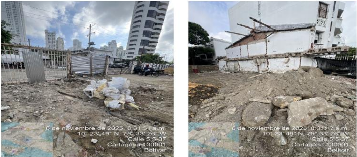
Ilustración 4: clasificación de los RCD.

Durante la visita de inspección, se evidencio que los Residuos de Construcción y Demolición RCD, generados durante el desarrollo de las actividades constructivas del proyecto, se encontraban dentro de la obra, y contaban con la debida protección al suelo. Adicionalmente, se evidencio la buena separación de los RCD según su tipo y la disposición de otro tipo de residuos.