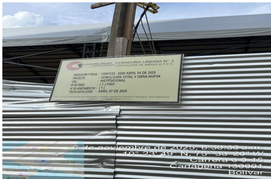
Ilustración 2:Valla informativa del proyecto.

Al momento de la visita, se logró evidenciar que el proyecto cuenta con la valla informativa por parte de la curaduría # 1 con el número de radicación y la fecha 13001125.-0206 Abril 04 de 2025, y la licencia de construcción 327 julio 11 del 2025, Obra Nueva, 1 Piso, institucional.