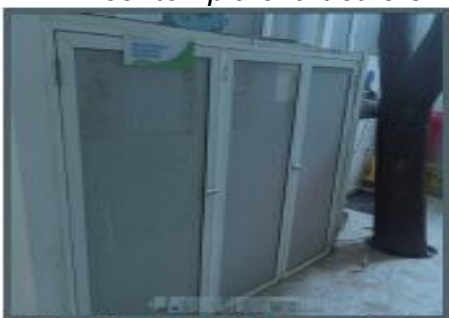
Foto 4. Cuarto de Almacenamiento