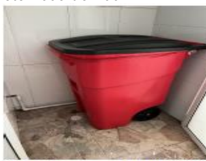
foto 5. Almacenamiento RESPEL