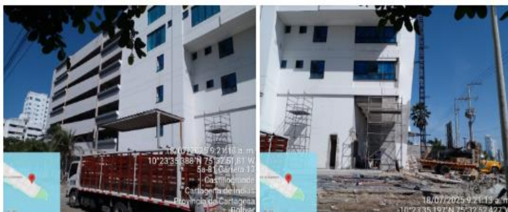
Figura 2. Fachada principal edificio Bella Luna

En esta se evidenció que el proyecto cuenta con diversos puntos de acopio de materiales ubicados estratégicamente en las diferentes áreas del proyecto en donde se adelantan actividades, sin embargo, algunos de dichos puntos no cuentan con la protección a suelo necesaria. Por otra parte, el desarrollo de las actividades de instalación de barandas de balcones en los pisos superiores genera material particulado debido al uso de taladros para perforar las salientes de concreto, pero no se evidenció la adopción de algún tipo de medida para mitigar la generación y suspensión del material particulado resultado de esta actividad.