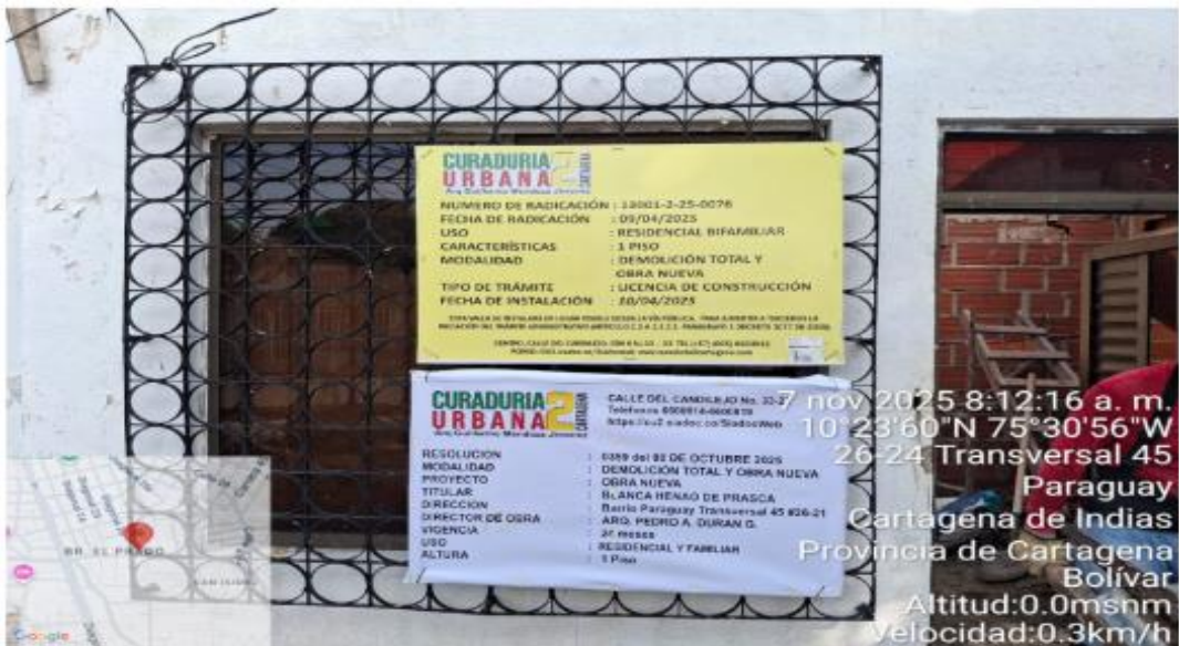
Ilustración 2: Valla informativa del proyecto. Fuente: Autores.

Al momento de la visita, se logró evidenciar que el proyecto cuenta con la valla informativa por parte de la curaduría # 2 con el número de radicación y la fecha 13001-2-25.-0076, el día 09 de abril de 2025, y la licencia de construcción 359 octubre 8 del 2025, Obra Nueva, 1 Piso, Residencial y familiar.