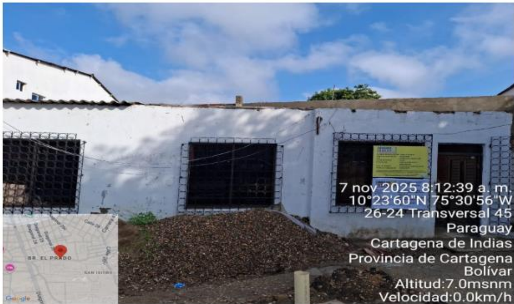
Ilustración 3: Blanca Henao De Prasca

El proyecto está en un avance del 50 % del cual se está desarrollando actividades de adecuación de fachada, del cual se está construyendo dos apartamentos para alquiler y actualmente cuentan con pin generador, # del pin 1-1468-001, del cual tiene vigencia hasta abril del 2026, del cual los residuos de construcción y demolición RCD, han sido reutilizados en la obra para la nivelación del terreno.