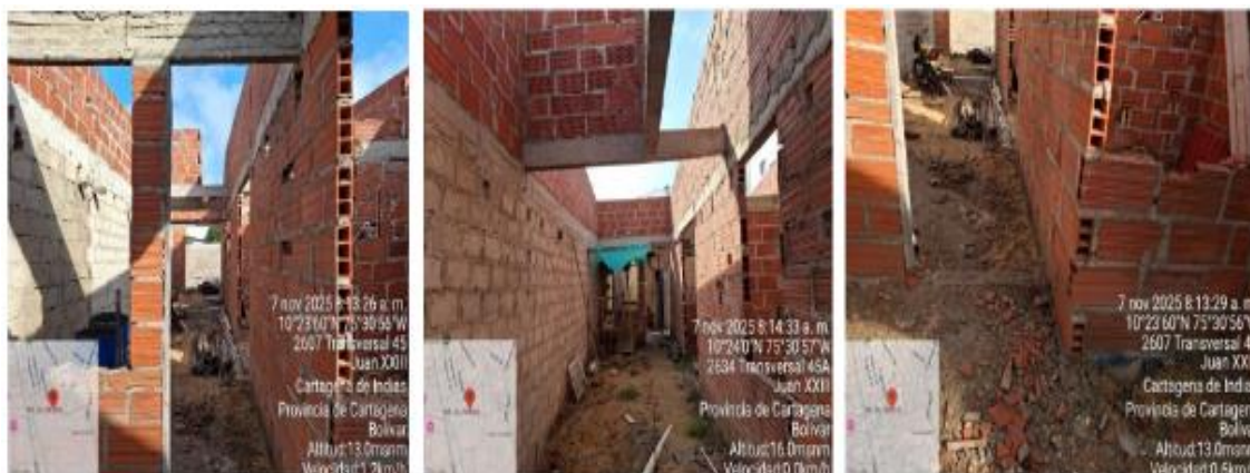
Ilustración 4: Adecuación de fachada