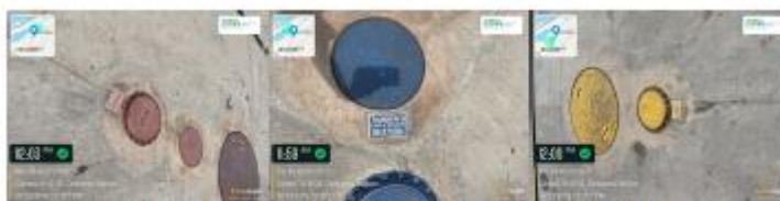
Figura 3. Tanques de almacenamiento de combustible