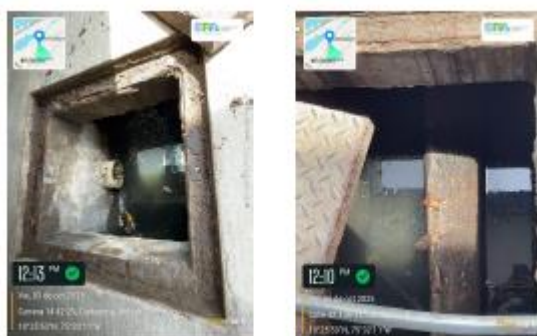
Figura 4. trampa de grasa EDS La Palenquera

La Estacion de Servicio (EDS) LA PALENQUERA Cuenta con una trampa de grasas para sus Aguas Residuales no Domesticas (ARnD), generadas por las actividades operativas de la estación, estas aguas son conducidas hacia la trampa a través de unas rejillas perimetrales donde se quedan contenidas para posteriormente ser succionadas por parte de la empresa EKIMAK SAS identificada con NIT 900.641945-1 la cual realizó succión el día 13 de marzo de 2025 una cantidad de ARnD de 3,5 m3 ( 3,675 kg) al año, lo que equivale a un total generado mensual de 306,25 kg/mes, teniendo en cuenta este resultado se clasifican como mediano generador.