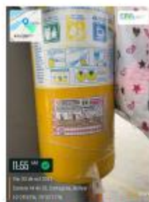
Figura 9. Extintores