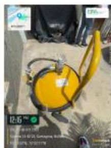
Figura 7. Extintores