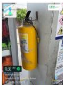
Figura 8. Extintores