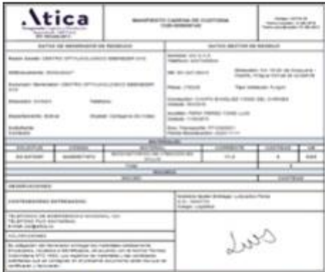
Ilustración 3. Manifiesto recolección 11/11/ 2025