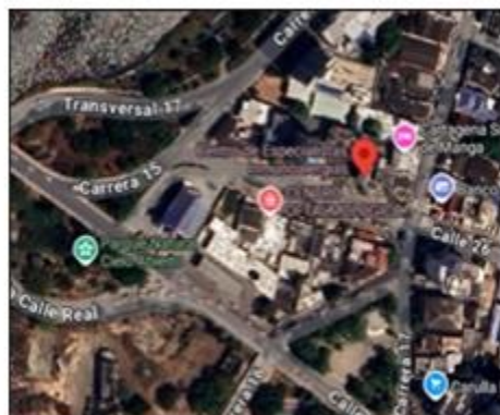
Ilustración 1. Vista satelital CENTRO OFTALMOLÓGICO EBENEZER S.A.S

CENTRO OFTALMOLÓGICO EBENEZER S.A.S está localizada el barrio Manga avenida Lacides de Segovia #16 – 60 en la ciudad de Cartagena de Indias D.T. y C. con coordenadas geográficas 10°25'0" N – 75°32'33" O