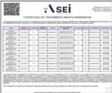
Ilustración 4. Certificado disposición final octubre

CENTRO OFTALMOLÓGICO EBENEZER S.A.S genera aguas residuales domésticas (ARD) provenientes de los lavamanos y baños y son conducidas al sistema de alcantarillado público.