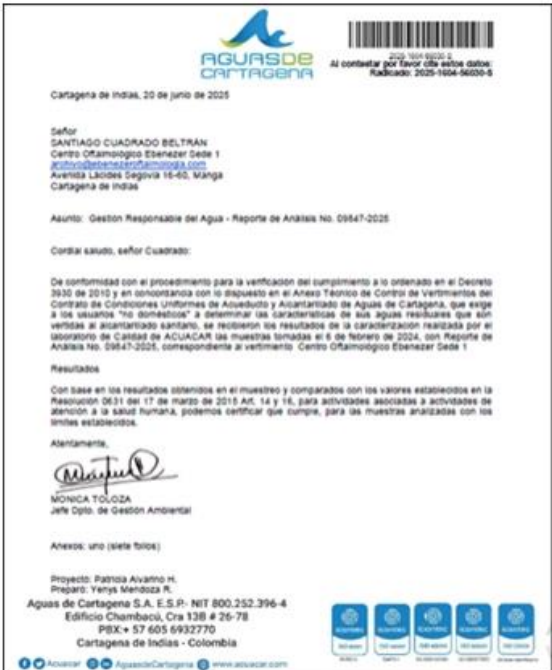
Ilustración 5. Reporte de análisis de cumplimiento ARnD.

CENTRO OFTALMOLÓGICO EBENEZER S.A.S también genera aguas residuales no domésticas (ARnD). Se pudo evidenciar que realizó caracterizaciones de estas aguas con fecha de muestras en febrero 6 de 2024 en el que estado de cumplimiento muestra que cumple en todos los parámetros con base a los niveles máximos permisibles en los artículos 14 ajustados al 16 de la resolución 0631 de 2015. No cuenta con un sistema o planta de tratamiento de aguas.