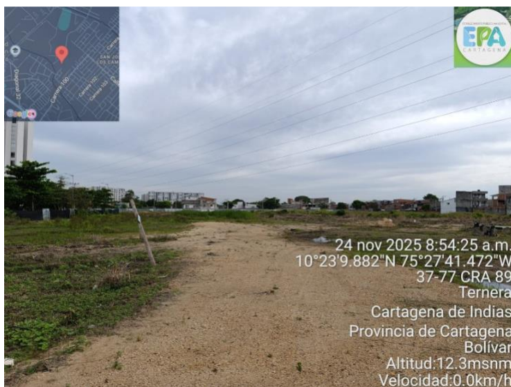
Figura 2. Estado actual del proyecto URBANISMO EMILIANI

En este sentido, queremos dejar constancia de se seguirán remitiendo oportunamente los informes trimestrales como generadores de RCD, conforme a lo establecido en la Resolución 1257 de 2021 con cantidades en cero, debido a que no se ejecutan actividades.”