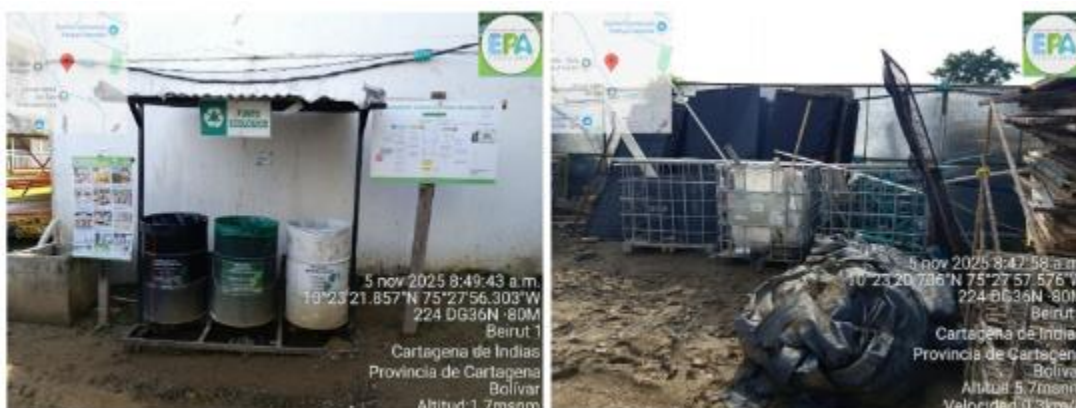
Figura 2. Puntos de clasificación y acopio temporal de residuos

Teniendo en cuenta el adelantado estado de las actividades constructivas en el proyecto BALTICO, la cantidad de residuos de construcción y demolición RCD pétreos se ha reducido considerablemente, mientras que residuos no pétreos como PVC, cartón y chatarra se encuentran más presentes dentro de esta etapa. Dichos residuos son clasificados y acopiados según su tipo y susceptibilidad de aprovechamiento, para lo cual el proyecto cuenta con diversos puntos de acopio temporal debidamente identificados teniendo en cuenta las características específicas de los residuos.