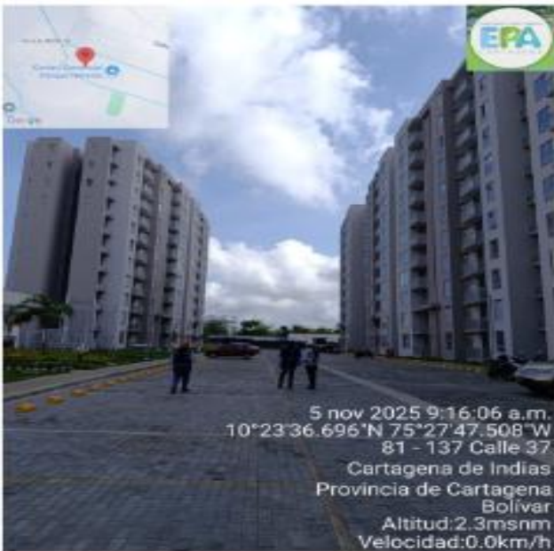
Figura 2. Proyecto CABO ALTO PARQUE HEREDIA.

Al momento de la visita, el proyecto se encuentra desarrollado en su totalidad, de acuerdo con lo establecido en el cronograma de proyecto, las actividades constructivas finalizaron en el mes de agosto.