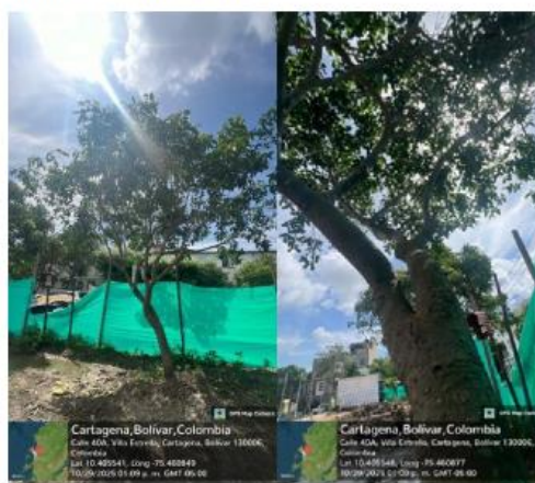
Imagen 11: (Melicoccus bijugatus) – Mamón, inclinación leve del ejemplar.