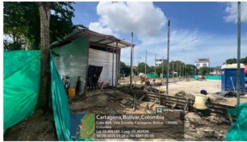
Imagen 2: Proyecto construcción, reconstrucción y adecuación de escenarios deportivos del distrito de Cartagena – Barrio villas de la Candelaria