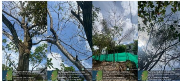
Imagen 7: (Tabebuia rosea) – Roble, árbol con ramificaciones secas y tronco seco, afectación por pajarita.