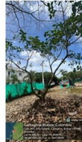
Imagen 4: (Terminalia catappa) Almendro, ubicación del árbol.