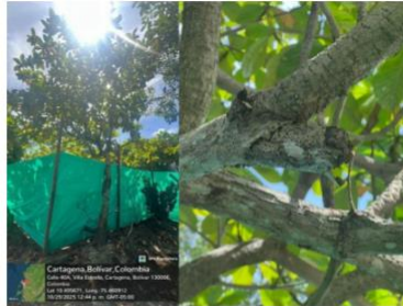
Imagen 3: (Terminalia catappa) Almendro, afectación por comején