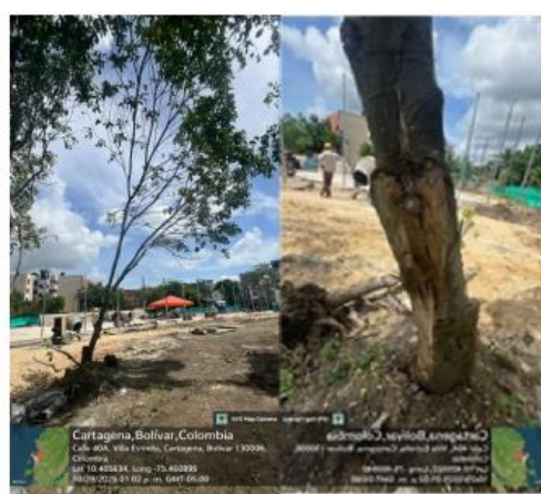
Imagen 9: (Melicoccus bijugatus) – Mamón, inclinación de árbol y afectación en el fuste