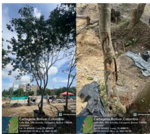
Imagen 10: (Melicoccus bijugatus) – Mamón, Afectación leve en el fuste