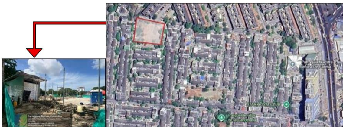
Imagen 1: Ubicación del proyecto Construcción, reconstrucción y adecuación de escenarios deportivos del distrito de Cartagena– Barrio Villas de la Candelaria