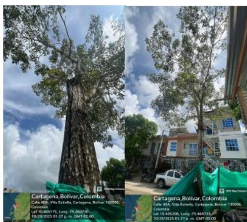
Imagen 8: (Tabebuia rosea) – Roble, ubicación de árbol