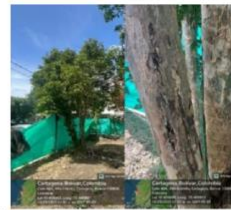
Imagen 6: (Guaiacum officinale) – Guayacán negro, afectación por hongos y comején