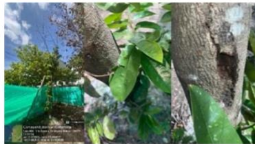
Imagen 5: (Annona muricata) – Guanábana, Daño foliar por insectos