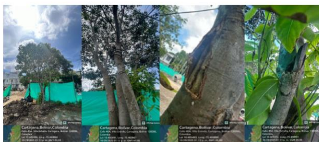
Imagen 12: (Melicoccus bijugatus) – Mamón, afectación por comején