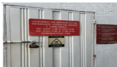
foto 5. Almacenamiento RESPEL

Durante los meses de enero y febrero los RESPEL fueron entregados 2 veces a la semana, los miércoles y sábados, a la empresa RED AMBIENTAL S.A.S. E.S.P para su recolección, transporte, incineración y disposición final de cenizas resultantes en celdas de seguridad.