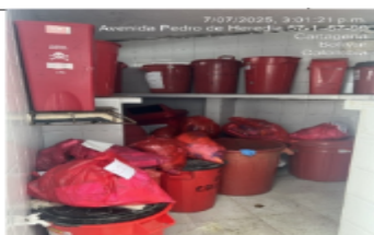
foto 6. Disposición RESPEL