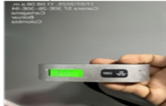
foto 8. Báscula