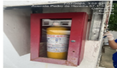
foto 7. Extintor