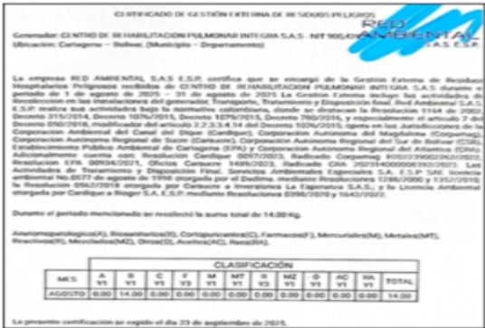
Imagen 2. Certificado gestión externa de agosto 2025

Se anexa certificado de gestión externa de residuos peligrosos del mes de agosto con un total de 14kg/mes y ultimo manifiesto de recolección del 15 de septiembre con 1,8kg de residuos biosanitarios como se evidencia en la imagen 2 y 3.