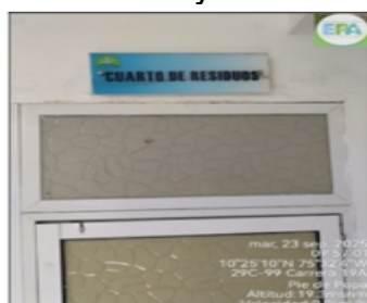
foto 6. Señalización RESPEL.