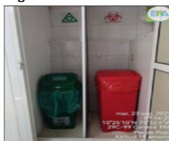
foto 7. Almacenamiento RESPEL