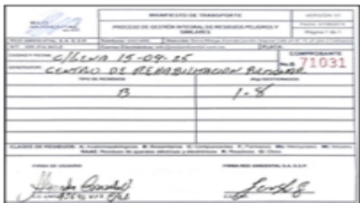
imagen 3. Manifiesto de recolección 15 de sept. 2025