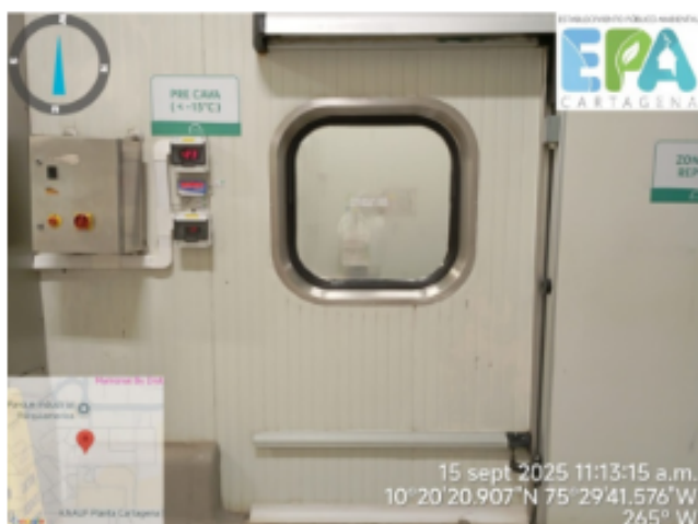
Figura 3. Bodega Congelación

Bodega de congelación. Esta opera a -25^{\circ}\text{C} , para la conservación de productos