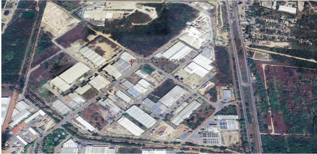
Figure 1. Ubicación geográfica del proyecto CONSTRUCCION BODEGA BASICA LOTE CA 20 ZFLC.