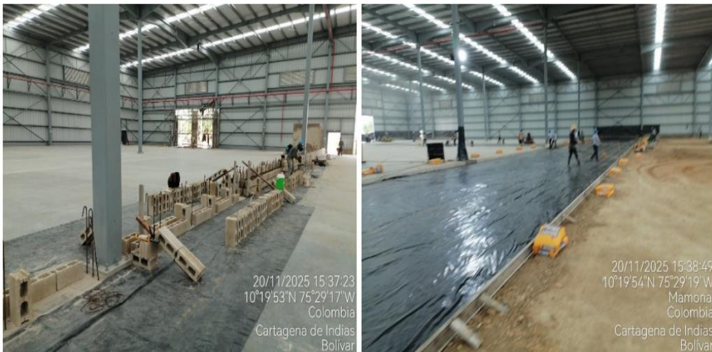
Figure 2. actividades de mampostería y adecuación de piso.

Durante la visita se evidenció que la DESARROLLADORA DE ZONAS FRANCCAS S.A. cuenta con un sitio para el acopio de los RCD producto de las actividades de acabado y pintura, y se estima un volumen aproximado de 20 m 3 de RCD.