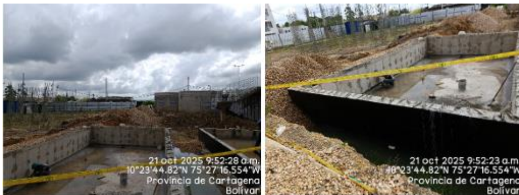
Figura 2. Ilustración 2: Actividades de cimentación en el proyecto

Finalmente, se presentó el vócher de disposición final de residuos de construcción y demolición RCD emitido por BIOGER, No. 95903 fechado el 19 de agosto de 2025.