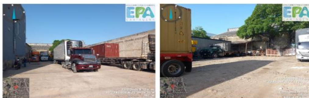
Figura 6 y 7. Parqueadero Servicios y Asesorías Diesel.

El parqueadero Servicios y Asesorías Diesel, aún sin pavimentar, no mostró a simple vista indicios considerables de emisión de material particulado, como nubes de polvo o polvaredas. Tampoco se observó evidencia física, como suciedad acumulada en superficies cercanas o polvo suspendido en el aire, especialmente PM10 y PM2.5, relacionadas con el levantamiento de polvo debido al tránsito vehicular. Este tipo de contaminación puede impactar la calidad del aire y representar riesgos para la salud respiratoria. Estas partículas principalmente compuestas de polvo mineral y elementos del suelo se producen por el movimiento de las llantas y podrían dispersarse hacia áreas cercanas. Asimismo, no se identificó evidencia de arrastre de barro o lodo dentro del parqueadero ni en los alrededores del corredor de carga (Figura 6 y 7).