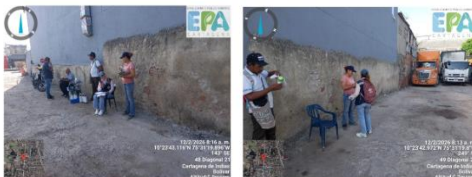
Figura 4 y 5. Parqueadero Servicios y Asesorías Diesel.

Durante la visita se observó que el parqueadero operaba con normalidad, proporcionando su servicio principal, que incluye la recepción, custodia, cuidado y devolución de vehículos, ya sean motorizados o no. Este servicio se ofrece bajo un esquema de cobro por fracciones de tiempo, horas, días o incluso meses. Asimismo, ofrece seguridad y espacios al aire libre (Figuras 4 y 5).