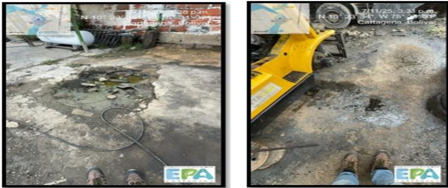
Figura 9. SUSTANCIAS PELIGROSAS

Cabe resaltar que, gran parte de la zona de trabajo no cuenta con plantilla y durante el recorrido se percibió que el suelo contaba con olores ofensivos y trazados que presuntamente pueden ser de aceite.