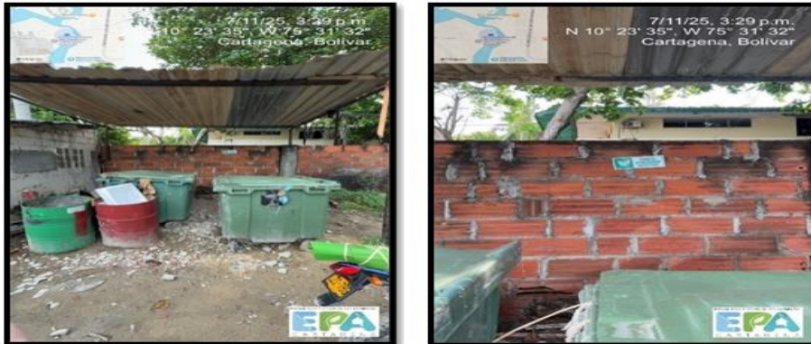
Figura 3. PUNTO ECOLOGICO

MONTACAR LOGISTIC S.A.S., cuenta con un punto ecológico ubicado en las áreas de operaciones de la empresa, este les ayuda a almacenar de manera temporal todos sus residuos generados, cabe resaltar que actualmente no cuentan con un punto de acopio, sin embargo, según informan ya están trabajando en el mismo. Durante el recorrido, se logró evidenciar que dicho punto ecológico, no cuenta con las especificaciones técnicas para la correcta clasificación y segregación de sus residuos, debido a que el mismo no cuenta con el código de colores ni con habladores para su correcta identificación.