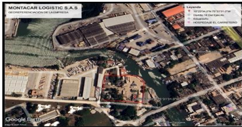
Figura 1. GEOREFERENCIACIÓN DE MONTACAR LOGISTIC S.A.S.

En el marco de cumplimiento de las actividades del Establecimiento Público Ambiental – EPA Cartagena, se realizó visita de seguimiento y control a la empresa MONTACAR LOGISTIC S.A.S., con la intención de verificar el cumplimiento de los requerimientos suministrados en la anterior visita de inspección, además de evidenciar los aspectos e impactos ambientales generados por sus actividades comerciales propias de esta empresa, la cual se encuentra ubicada en Bosque Transversal 52 No. 17-117 Isla de Gracia (Manzanillo) y con coordenadas N 10° 23' 34", W 75°31'31".