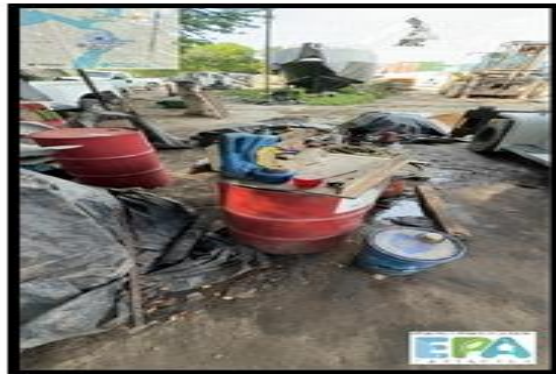
Figura 15. SUSTANCIAS QUÍMICAS

MONTACAR LOGISTIC S.A.S., no cuenta con un sistema globalmente armonizado, a pesar de que cuenta con sustancias químicas, estas mismas no se evidenciaron en un lugar dispuesto para su correcto almacenamiento ni con su ficha de seguridad o matriz de compatibilidad.