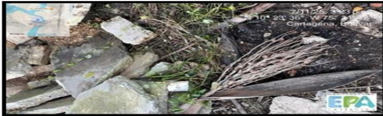
Figura 10. SUSTANCIAS PELIGROSAS

A pesar de no contar con sitios adecuados para la disposición de sus residuos y disponer inadecuadamente los residuos la empresa cuenta con un gestor autorizado para la disposición de los residuos peligrosos y suministraron certificados de disposición, no obstante, según los certificados de disposición, realizan disposiciones cada 5 meses.