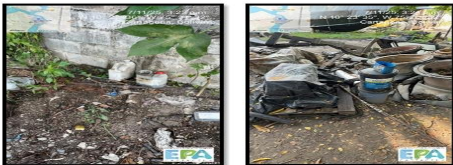
Figura 7. DISPOSICIÓN INADECUADA DE RESPEL

MONTACAR LOGISTIC S.A.S., por su actividad la empresa genera varios residuos peligrosos, dentro de los cuales se destaca los aceites usados, waipes contaminados, materiales contaminados con aceite, combustible, pintura, entre otros. Para el tratamiento de estos residuos peligroso, la empresa cuenta con un Plan de Gestión Integral de Residuos, este mismo fue enviado y evaluado, si bien contempla muchas actividades y residuos generados de su actividad, durante el recorrido se evidenció varios residuos peligrosos dispuestos de manera deliberada, además no realizan una correcta segregación o clasificación de estos residuos, a su vez tampoco cuentan con una zona adecuada para almacenar y contener los residuos peligrosos.