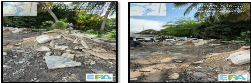
Figura 6. RCD

La señora Ketty informó que han hecho modificaciones en su infraestructura y cambios, sin embargo, no suministraron PIN de generación de RCD, no obstante, también informó que aún no han hecho disposiciones ya que piensan utilizar este RCD para adecuaciones, se le sugirió que debería contar con PIN para las adecuaciones de su infraestructura y además contar con un gestor autorizado para los RCD que se dispongan.