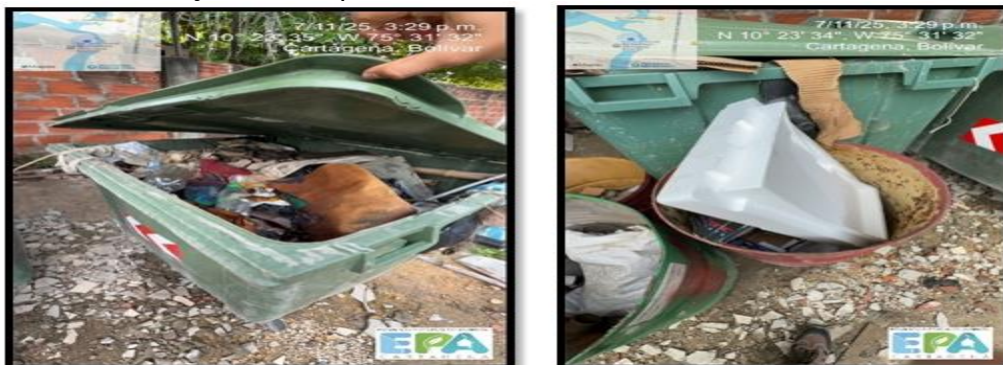
Figura 4. SEGREGACIÓN INADECUADA DE RESIDUOS

Durante el recorrido de inspección se evidenció mala segregación de los residuos, esto debido a que no cuentan con suficientes puntos de recolección y almacenamiento de sus residuos, además, también se evidenció residuos dispuestos de manera inadecuada en toda el área de trabajo de la empresa.