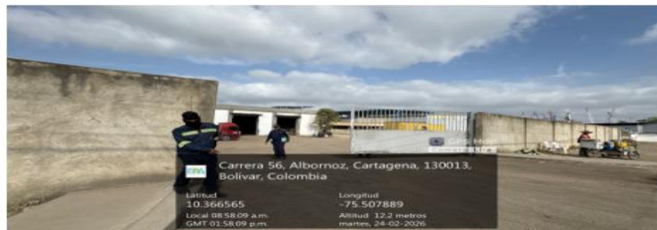
Figura 2. Fachada de CONSTRUCTORA EMMA LTDA

Durante la visita al parqueadero se observó que la empresa opera en normalidad, el administrador expresa que las instalaciones operan como un centro logístico y que los vehículos de carga pesada ingresan y salen durante la jornada laboral, se evidencia que en el parqueadero no se han implementado medidas de mitigación ambiental para la emisión de material particulado.