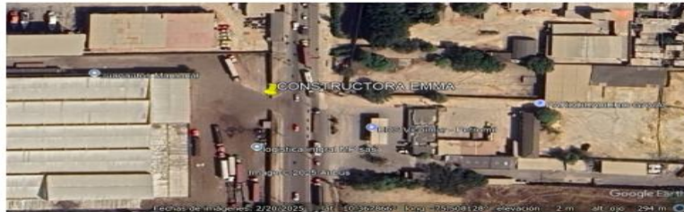
Figura 1. Ubicación del parqueadero constructora EMMA

Se realizó visita técnica de control y seguimiento el día 24 de febrero de 2026 siendo las 8:50 a. m. atendida por el administrador del establecimiento el señor Alexander escobar Jiménez, al parqueadero de la empresa denominada CONSTRUCTORA EMMA LTDA, ubicado en el corredor de Carga Mamonal kilómetro 2 kra 56 #1 -194 sector Albornoz con coordenadas geográficas latitud 10°366598"N – 75°507921, con número de NIT 805014109-1, en la visita realizada se verificaron las emisiones atmosféricas establecido en el AUTO No. EPA-AUTO001525-2025 de martes, 26 de agosto de 2025 por el establecimiento público ambiental.