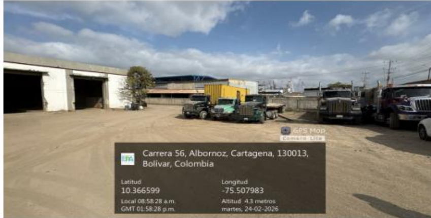
Figura 3: Instalaciones del Parqueadero de la Constructora Emma LTDA