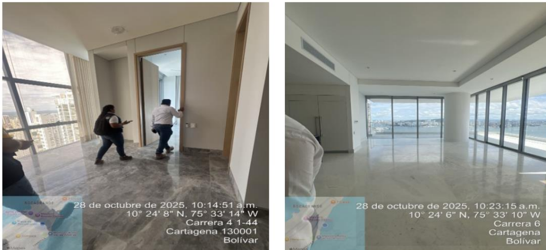
Figura 2. Terminación del proyecto Allure

Al momento de la visita se evidenció que el proyecto en construcción “ALLURE” había sido culminado en su totalidad. Durante el recorrido no se observaron frentes de obra activos ni personal ejecutando actividades constructivas, lo cual confirma que las intervenciones físicas ya finalizaron. Asimismo, se constató que el proyecto se encontraba en etapa de entrega de los apartamentos a los propietarios, lo que indica que el proceso constructivo avanzó a su fase final de ocupación y puesta en funcionamiento. Esta condición permite concluir que, para la fecha de inspección, no se generaban residuos ni impactos asociados a actividades de construcción.