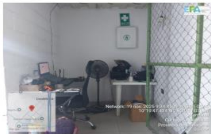
Figura 3. Oficinas