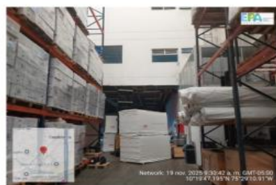
Figura 4. Bodega.