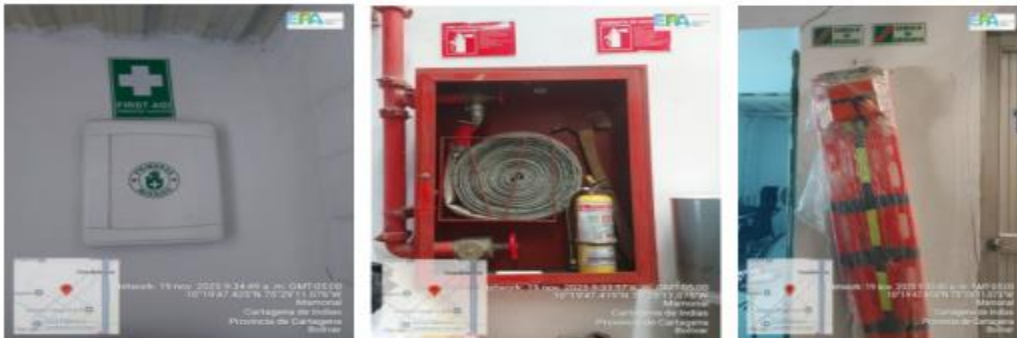
Figura 8, 9 y 10. Equipos y herramientas PGRD.

En la bodega se identificaron equipos para atender emergencias y contingencias, tales como una red contra incendios, extintores, señalización, salidas de emergencia, camillas y un botiquín de primeros auxilios (8, 9 y 10).