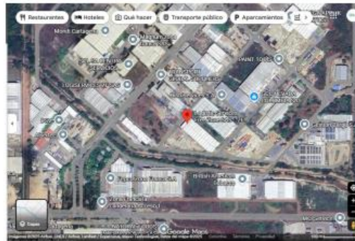
Figura 1. Ubicación Geográfica de la empresa 4PLC FREE ZONE S.A.S.

En cumplimiento al programa de seguimiento ambiental se practicó visita de seguimiento y control a las instalaciones de la empresa 4PLC FREE ZONE S.A.S con NIT. 901.345.659-2. ubicada en la dirección Mamonal Km 9 Zona Franca la Candelaria Etapa 1 Bodega G38., la cual corresponde a la localidad N°3 Industrial de la Bahía en la ciudad de Cartagena de Indias, aproximadamente en las coordenadas geográficas 10°19'48.261"N - 75°29'11.855"W (Figuras 1 y 2).