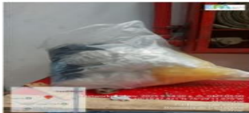
Figura 7. Residuos Aprovechables.

No se identificó la existencia de un punto de acopio temporal destinado al almacenamiento de estos residuos sólidos aprovechables (Ver Figura 7).