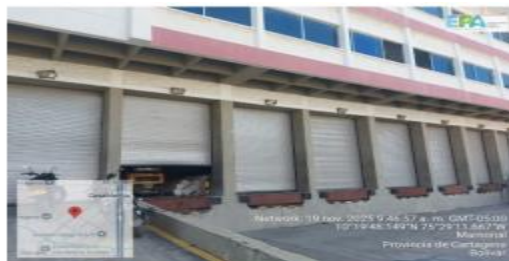
Figura 5. Área de Cargue y Descargue.