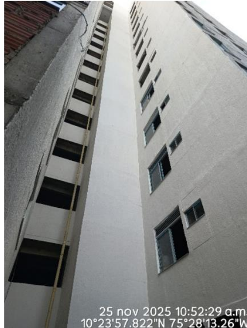
Figura 2: Fachada del proyecto SOTAVENTO CLUB HOUSE.