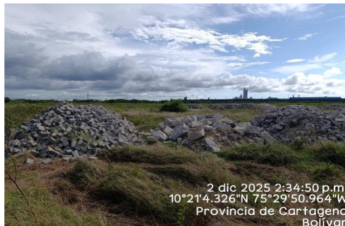
Ilustración 2: Acopio de RCD.