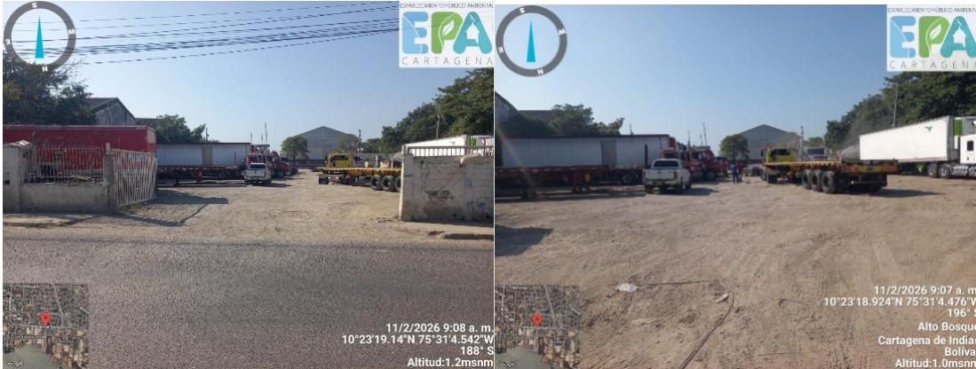
Figura 5 y 6. Parqueadero TRTANS LOGISTICA SAJAKE.