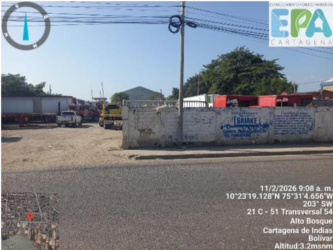
Figura 2. Fachada principal del Parqueadero TRTANS LOGISTICA SAJAKE

Para dar cumplimiento a lo establecido en el numeral cuarto de la sentencia, la Subdirección Técnica y Desarrollo Sostenible, a través del Área de Control y Seguimiento Ambiental, llevó a cabo labores de vigilancia y control en el parqueadero TRTANS LOGISTICA SAJAKE. Este sitio no cuenta con pavimentación interna en sus áreas, por lo que se realizó la revisión correspondiente para evaluar la problemática relacionada con la contaminación por barro o lodo generada por el tránsito de los vehículos en dicho parqueadero.