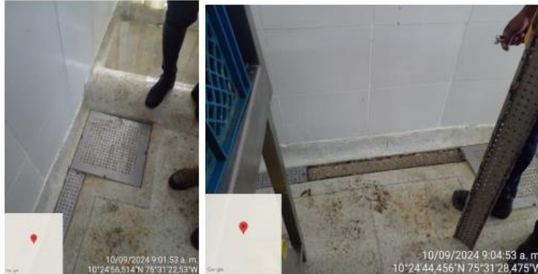
Imagen 4: Rejillas de retención de residuos sólidos.

Tanto las aguas residuales domésticas como las no domésticas son conducidas al registro principal de aguas residuales del establecimiento, el cual se encuentra enfrente del establecimiento.