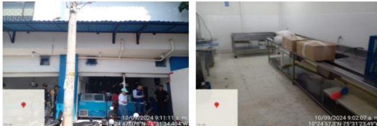
Imagen 3. Distribución espacial del establecimiento.

COPEMA S.A.S divide sus instalaciones en: un cuarto de limpieza en el que realizan el lavado, corte y limpieza del pescado, un cuarto frío en el cual se conservan los pescados y mariscos, oficina administrativa y el área de ventas en donde se exhibe todos los productos a la venta en refrigeradores y congeladores. Por otro lado, cuenta con un baño y un lavamanos y su fuente abastecedora es Aguas de Cartagena S.A E.S.P.