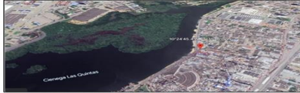
Imagen 1. Localización geográfica de COPEMA S.A.S Coordenadas 10°24'45.378"-75°31'36.024"

El establecimiento comercial COPEMA, se encuentra ubicado en el barrio Chino Cra. 25 #29B – 17, sobre la Avenida del lago, en las coordenadas geográficas 10°24'45.378"-75°31'36.024". Este establecimiento se encuentra registrado bajo la razón social COMERCIALIZADORA DE PESCADO Y MARISCOS AYA & ARCINIEGAS S.A.S., identificada con NIT: 806004589-8.