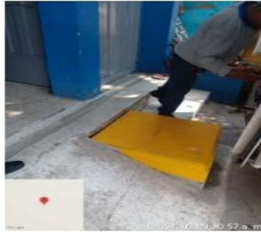
Imagen 5: Registro de aguas residuales del establecimiento.

Tanto las aguas residuales domésticas como las no domésticas son conducidas al registro principal de aguas residuales del establecimiento, el cual se encuentra enfrente del establecimiento.