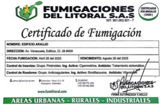
Figura 4. certificado fumigación