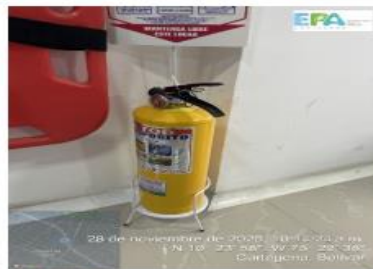
Foto 4. Extintor