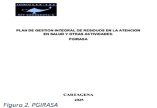
Figura 2. PGIRASA

El Manual de Procedimientos para la Gestión Integral de los Residuos Hospitalarios y similares, adoptado mediante la resolución 0591 de 2024, exige el diseño e implementación del PGIRH y establece los aspectos que debe contemplar. Durante la visita se verificó que cuenta con un Plan de Gestión Integral de Residuos Generados en la Atención de Salud y otras Actividades (PGIRASA) actualizado el 10 de junio de 2025 y cumple con las actividades que realiza y protocolo de bioseguridad, diagnóstico de generación de residuos, separación y/o clasificación, conformación del grupo de gestión ambiental y sanitaria, movimiento interno de residuos, recolección interna y externa realizada por el gestor, programa de capacitación, diligenciamiento del formato RH1 y cálculo de indicadores de gestión de residuos hospitalarios y similares.