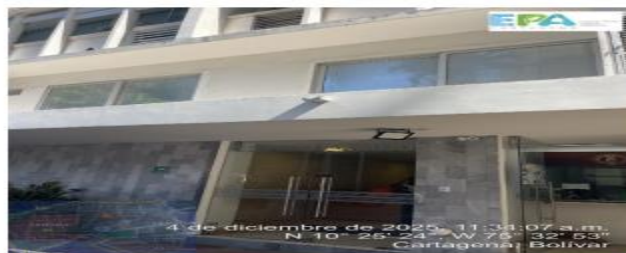
foto 1. Vista frontal de cedeco ger.

CEDECO GER SAS, está localizada en el Centro la matuna edificio arujo 5 piso 09, coordenadas geográficas N10°25'24" W 75°32 '53"