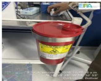
Foto 2. Guardian