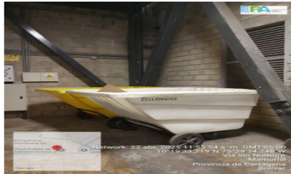
Figura 5. Punto de acopio temporal de residuos aprovechables

La empresa cuenta en cada bodega con un punto de acopio temporal, con piso en cemento y bajo techo, también se evidenció puntos ecológicos en las diferentes áreas de la empresa (figura 5).